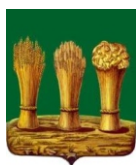
Администрация города Пензы