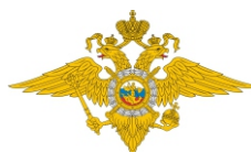
УМВД России по Пензенской области